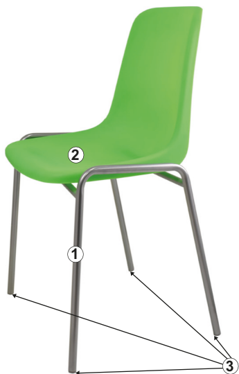
СХЕМА СБОРКИ СТУЛА «СТРИТ»