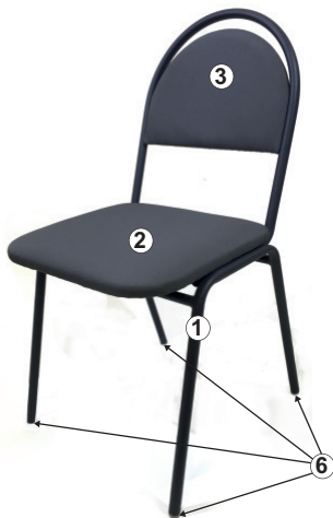
СХЕМА СБОРКИ СТУЛА «ОФИСНЫЙ»