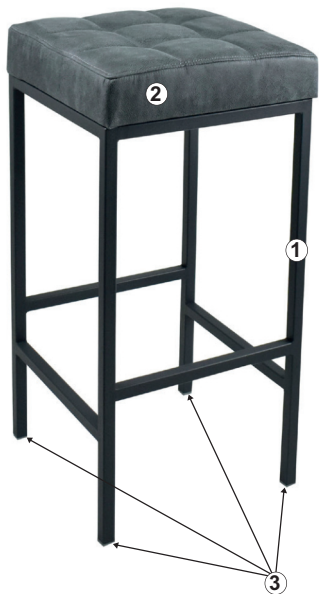
СХЕМА СБОРКИ СТУЛА «ОЛИМПИЯ», «ОЛИМПИЯ П.БАРНЫЙ»