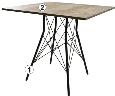
СХЕМА СБОРКИ СТОЛА «ПГ-40»